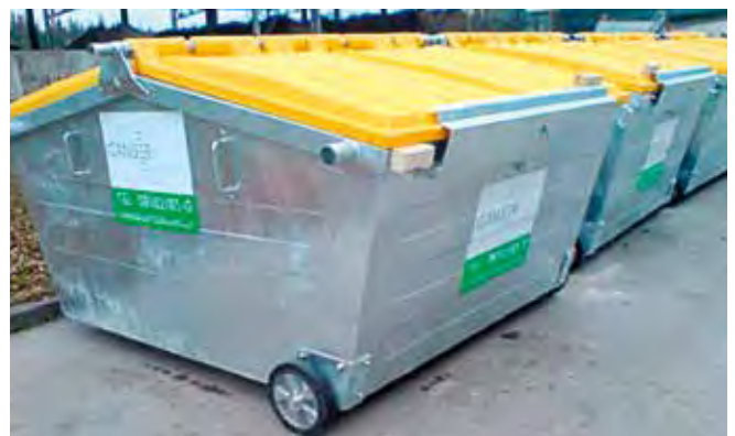
Umleerbehälter 5 m³