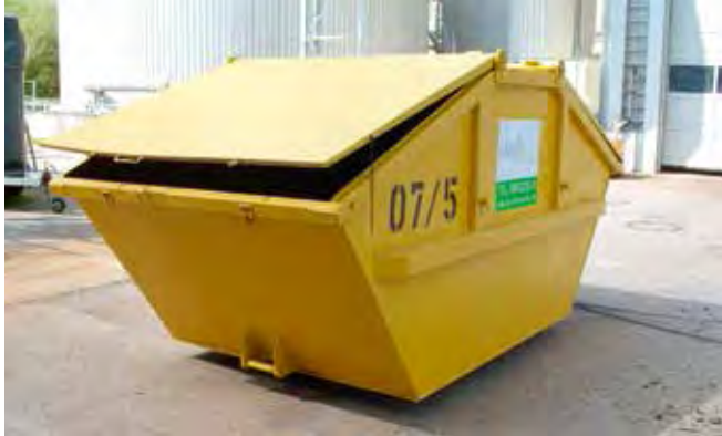
Absetzcontainer 7 m³ mit Deckel