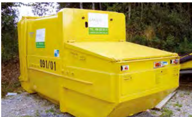
Absetzpresscontainer 10 m³