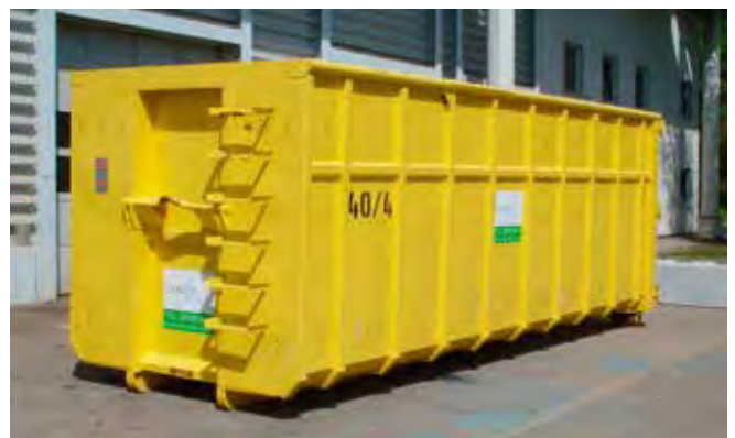
Abrollcontainer 40 m³