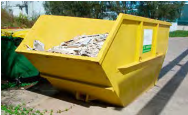
Absetzcontainer 10 m³ offen