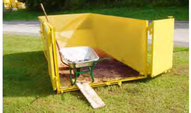
Container 7 m³ mit Türen