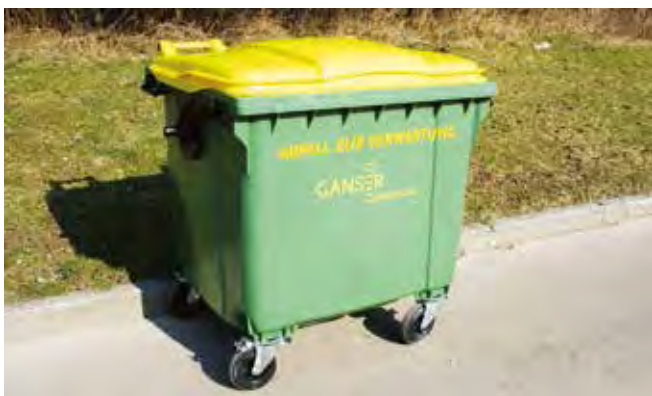
Umleerbehälter 1,1 m³